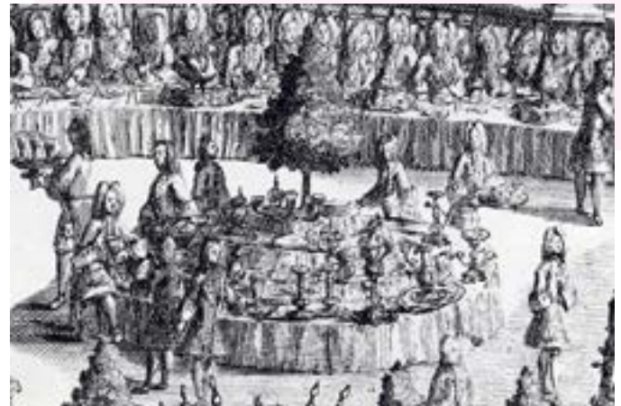
Festtafel beim Convivium der Bürgercapitains im Hamburger Drillhaus, 1719 (Ausschnitt)

Hinweise: Für das Buffet ist bis spätestens 1. März 2026 eine zahlungspflichtige Reservierung in Form einer Ticketbuchung erforderlich. Tickets für das Buffet können telefonisch unter 0391 540 40 00 oder online unter www.telemann.de erworben werden und sind für den Zugang zum Buffet im Hotel Ratswaage vorzuzeigen.