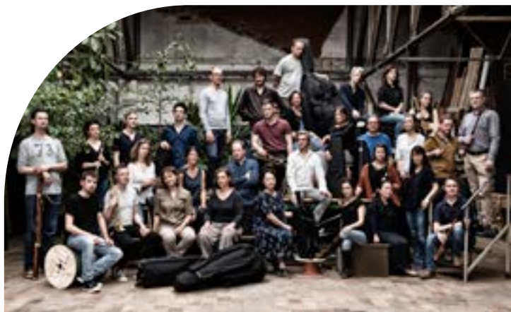
B'Rock Orchestra