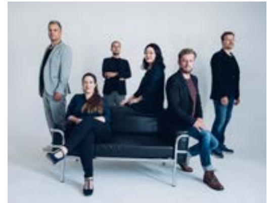
Oben: Wrocław Baroque Orchestra – ; Unten: Ensemble Polyharmonique