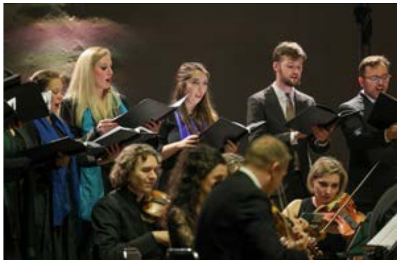
Vox Luminis

Wenn es um die Vermittlung geistlicher Inhalte an die Gemeinde geht, dann müssen alle zu Gebote stehenden Mittel zum Einsatz kommen. Darin waren sich der Poet, Theologe und Rhetoriker Erdmann Neumeister und Tele- mann einig – und generell ist die Ausformung geistlicher Musik im protestantischen Raum um 1700 maßgeblich von dieser Ansicht geprägt. Die affektrichtigste Poesie der Zeit war die der Oper und der weltlichen Kantate italienischer Prägung. Neumeisters konsequente Über- tragung dieser Dichtungsform auf kirchenmusikalische Jahrgangstexte, bei denen zu Rezitativ und Arie die expli- zit geistlichen Komponenten Bibelspruch (Dictum) und Choral traten, führte zum Geistlichen Singen und Spielen . In Telemanns Vertonung dieser Textfolge von 1710/11 für Eisenach entstand ein für die protestantische Kirchen- musik mustergebender Jahrgang. Neumeisters exzeptio-