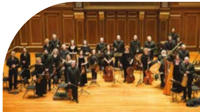
Boston Early Music Festival Orchestra

Karl Wilhelm Ramlers Dichtung Ino über die gleichnamige Figur aus der klassischen Mythologie ist ein packendes Meisterstück, in dem die rohe Gewalt der Götter auf den einzelnen Menschen in seiner Zerbrechlichkeit einwirkt. Die Titelheldin wird zum Spielball höchster Mächte, ist gleichermaßen göttlicher Rachsucht und göttlicher Gnade ausgeliefert. Telemann, der in hohem Alter die jugendhafte Avantgarde Ramlers schätzte, schuf mit ca. 86 Jahren eine Vertonung dieses Textes, in der Musik geradezu zur körperlichen Erfahrung wird. Inos Flucht vor ihrem mit