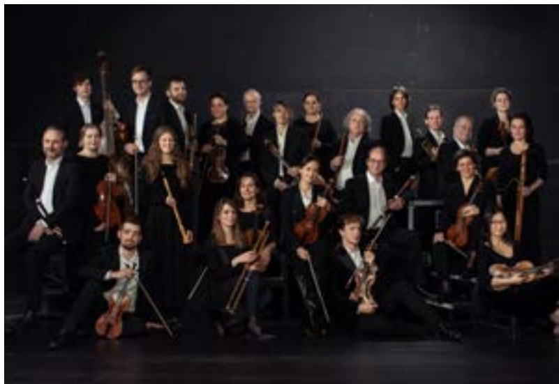
Il Gardellino Orchestra

Mit dem das Festivalmotto aufgreifenden Eröffnungskonzert entfaltet sich ein klangprächtiges Panorama, das Telemann als bemerkenswerten Gestalter musikalischer Repräsentation ins Zentrum rückt. Die Werke aus der frühen, mittleren und späten Hamburger Schaffenszeit stehen exemplarisch für Telemanns Fähigkeit, Musik als Mittel politischer, gesellschaftlicher und kultureller Kommunikation zu nutzen. Die Admiralitätsmusik von 1723 feiert nicht nur das einhundertjährige Jubiläum des damals bedeutenden Hamburger Admiralitätskollegiums, sondern inszeniert die einst für die Hamburger Seeschiffahrt bedeutsame Verwaltungs-, Schutz- und Gerichtsbehörde mit betörender Klangfülle. Ebenso gezielt agierte Telemann in seinen Werken für die Dresdner Hofkapelle (um 1740) und den Landgrafen von Hessen-Darmstadt (1765), die Erwartungen an Repräsentation, kompositorische Raffinesse und Virtuosität souverän aufgreifen. Ganz ähnlich ließe sich auch Telemanns Drucksammlung Musique de Table charakterisieren. Sie erschien 1733 im Selbstverlag des Komponisten und gleicht einem Kompen-