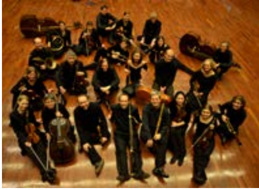
Kölner Akademie

Klangkörper und den genau auf den Anlass zugeschnittenen Texten erfüllen die Musiken komplexe Aufgaben von der Huldigung Frankfurts an das Kaiserhaus bis zur großangelegten Freudenfeier. Immerhin ging es hier um einen Thronfolger, der für den Fortbestand der habsburgischen Linie nötig war und dessen Geburt den Untertanen die Sorge vor einem erneuten Erbfolgekrieg (nach dem soeben erst beendeten spanischen) nahm. Zugleich konnte der Frankfurter Magistrat in einer Phase innenpolitischer Schwierigkeiten ein positives Signal nach Wien senden. Selten wird die enge Verbindung von Politik und Kunst so klar in einem Werk erfahrbar, überstrahlt von einer großen Dankbarkeit für Frieden wenigstens innerhalb der deutschen Grenzen.