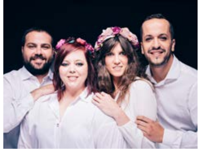
L'Apothéose

Als Telemann im Jahr 1737 nach Paris reiste, war er dort beileibe kein Unbekannter mehr. Bereits seit Jahren hatten sich Drucke mit seinen Kompositionen in der Stadt verbreitet und stießen unter Kennern und Liebhabern auf allergrößtes Interesse. So führt die Subskribentenliste der Sammlung Musique de Table (Hamburg 1733) bereits auffällig viele, oft gut betuchte Pariser Käufer auf. Die Nouveaux quatuors , 1738 mit Privileg des französischen Königs gedruckt, wurden von den besten Pariser Musikern aufgeführt und befestigten die „fast allgemeine Ehre“, die Telemann laut seinen eigenen Worten bei seinem Besuch an der Seine zuteilwurde. Nach 1752 erschien zudem mit dem Quatrième livre de quatuors eine weitere, nicht durch den Komponisten autorisierte Sammlung von exquisiten Sonaten, die der Pariser Verleger Le Clerc aus älteren